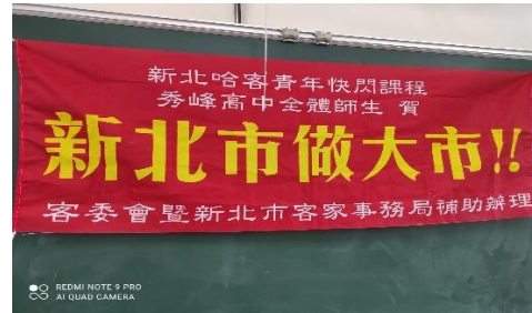
文字說明：宣傳活動布條