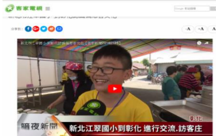
(範例)客家電視台報導 江翠國小認識偏鄉客家文化