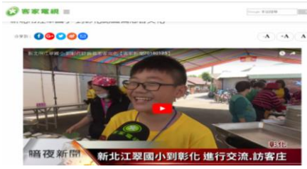
(範例)客家電視台報導江翠國小認識偏鄉客家文化