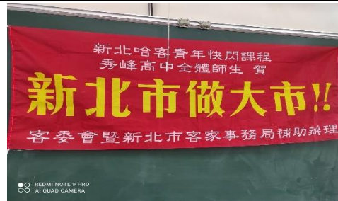
文字說明：宣傳活動布條