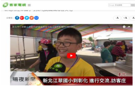
(範例)客家電視台報導 江翠國小認識偏鄉客家文化